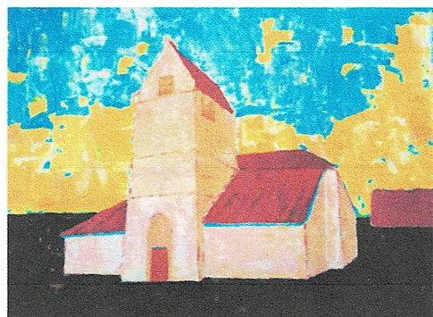
Dorpskerk van Bathmen - Hans Schaap